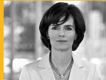
N. Leibinger-Kammüller Dr. Nicola Leibinger-Kammüller

Schirmfrau des Fördervereins Wildwasser Stuttgart e.V. Vorsitzende der Geschäftsführung TRUMPF GmbH + Co. KG, Ditzingen